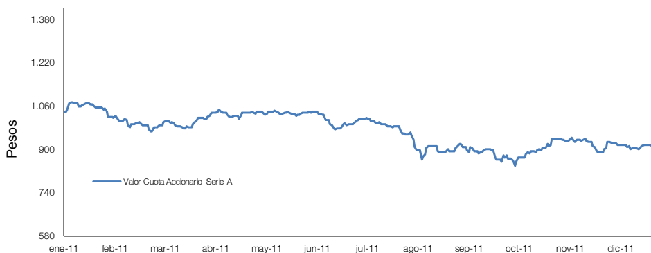
Gráfico Variación Acumulada Serie A