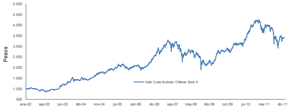
Gráfico Variación Acumulada Serie A (base 100)